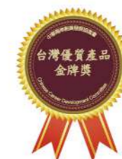
台湾优秀产品金奖