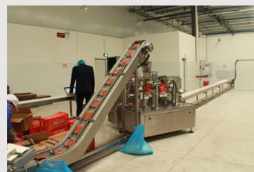
全自动外袋包装机