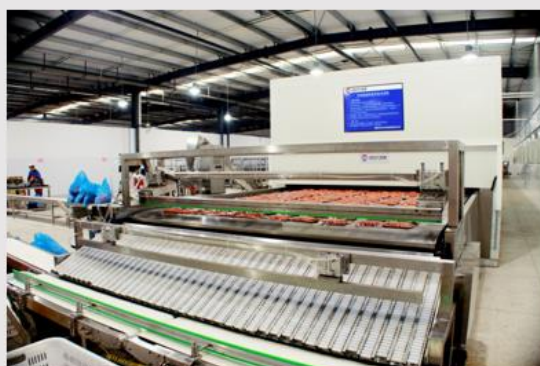
全自动合流摆袋机