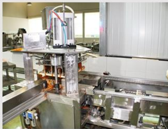
块状火锅底料切块机