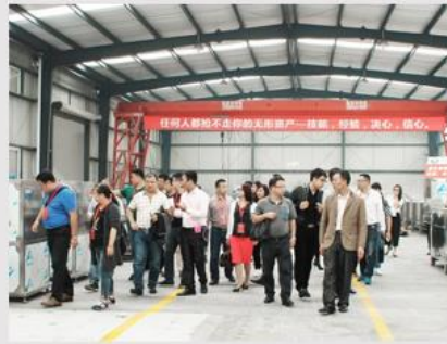
全国火锅代表参观中科华力车间