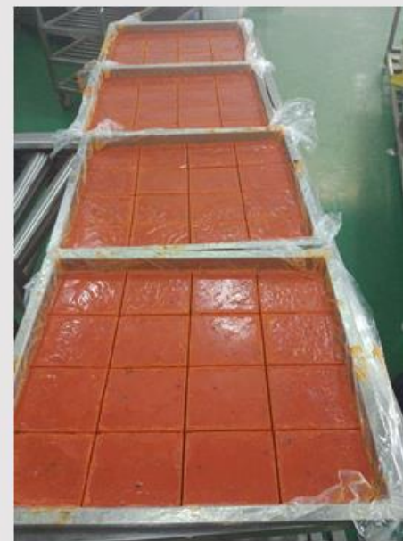
块状火锅底料成品