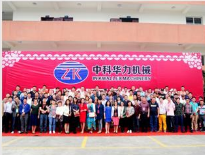
全国火锅代表参观留影