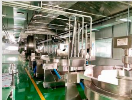
火锅底料炒制车间