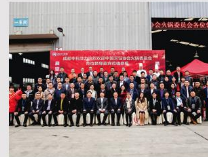
中国饭店协会火锅委员会参观中 科华力合影留念