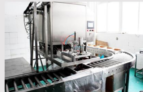
块状火锅底料灌装机