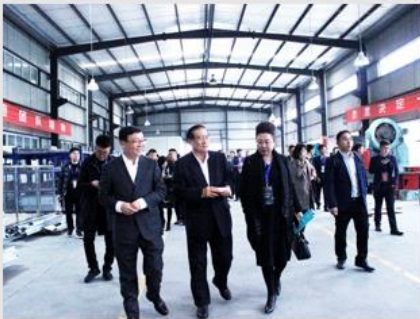
中国饭店协会火锅委员会 李会长一行参观中科华力