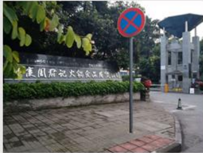
重庆周君记公司正门