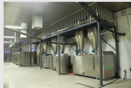
全自动油料分离平台