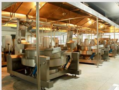
火锅底料炒制车间