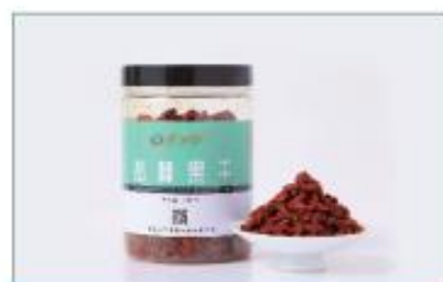
沙棘果干(100g 装) 净含量: 100g/ 罐 规格: 100g/ 罐 ×1 罐