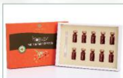
低温压榨沙棘全果油 净含量：30ml/盒 规格：3ml×10瓶