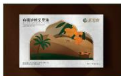
有机沙棘全果油 净含量：30ml/盒 规格：3ml×10瓶