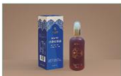
沙棘全果油(单瓶装) 净含量：100ml/盒 规格：100ml/瓶×1瓶