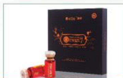
沙棘全果油 3ml 礼盒 净含量：126ml/盒 规格：3ml×42瓶