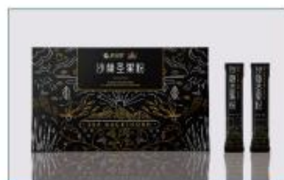
沙棘圣果粉 净含量: 150g/ 盒 规格: 10g×15 袋