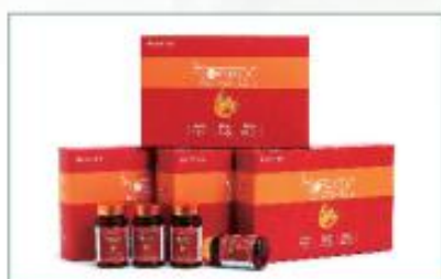
低温压榨沙棘全果油凝胶糖果 净含量：30g/盒 规格：500mg×60粒