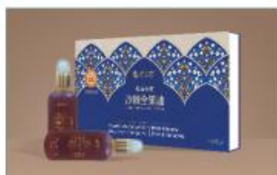
沙棘全果油(礼盒装) 净含量：200ml/盒 规格：100ml×2瓶