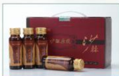
有机沙棘原浆(玻璃瓶装) 净含量: 500ml/ 盒 规格: 50ml×10 瓶