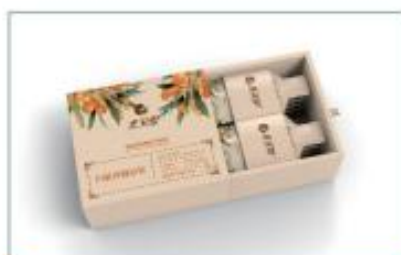
有机沙棘原浆(自立袋装) 净含量: 300ml/ 盒 规格: 30ml×10 袋