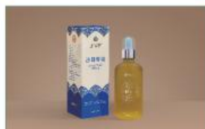
沙棘籽油(单瓶装) 净含量：100ml/盒 规格：100ml/瓶×1瓶