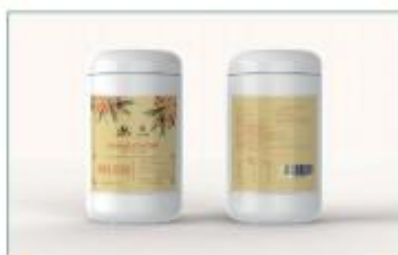
沙棘果粉(桶装) 净含量: 500g/ 桶 规格: 500g/ 桶 ×1 桶