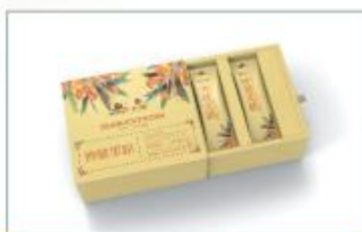
沙棘果粉(条袋装) 净含量: 150g/ 盒 规格: 15g×10 袋