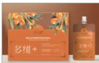
多维沙棘原浆饮料 净含量: 500ml/ 盒 规格: 50ml×10 袋