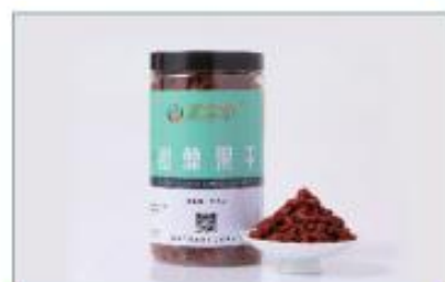
沙棘果干(200g 装) 净含量: 200g/ 罐 规格: 200g/ 罐 ×1 罐