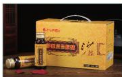
沙棘复合原浆(玻璃瓶装) 净含量: 500ml/ 盒 规格: 50ml×10 瓶