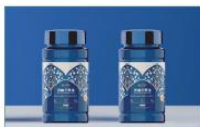
沙棘全果油凝胶糖果 净含量：45g/瓶 规格：500mg×90粒