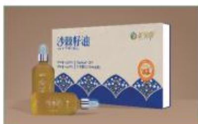
沙棘籽油(礼盒装) 净含量：200ml/盒 规格：100ml×2瓶